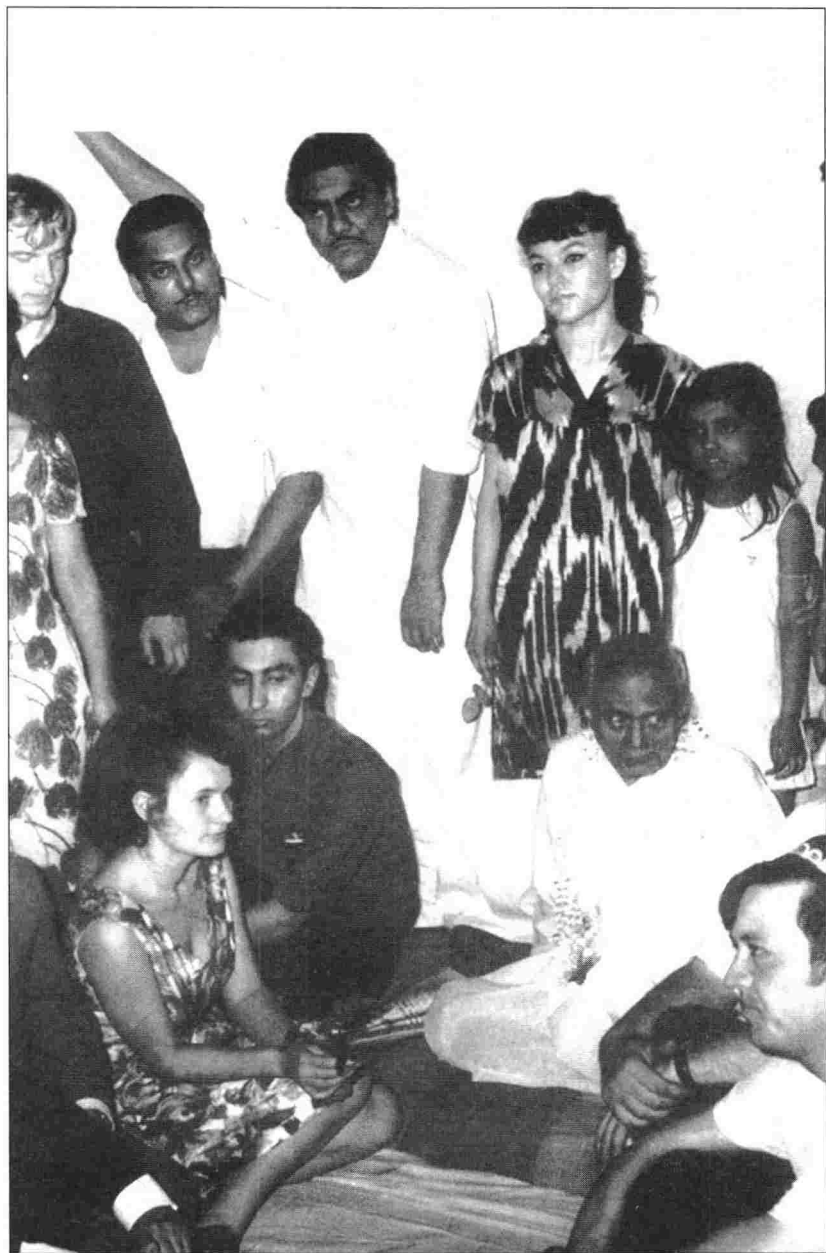
সোভিয়েত প্রতিনিধিদের মাঝখানেে নজরুল । রুশ ভাষায় অনূদিত নজরুল রচনা-প্রকাশ অনুষ্ঠানে (১৯৬৭)